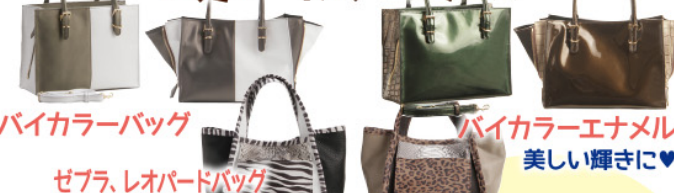
バイカラーバッグ